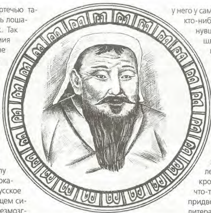
Чингисхан. С китайского портрета XIII в.

Едва только показался поблизости купеческий караван, как «...пушки с острова палят, кораблям пристать велют...». Приглашение, сделанное с помощью пушек, не проигнорируешь. А во дворце их сам князь находит время среди государственных забот подробно расспросить. Но этого князю мало, и он не считает для себя зазорным переодеться комаром и лично проникнуть во дворец Салтана, где разузнать, не плетутся ли там против его княжества и него лично какие-либо интриги. Может быть, князь Гвидон — из молодых, да ранних? Совсем нет. В это же самое время уже этих же самых купцов расспрашивает Салтан, задавая им почти те же самые вопросы. И всё он от них узнаёт вовремя: и о возникновении недалеко от рубежей его державы островного города-государства. И о появлении там нового источника конвертируемой валюты. И об усилении береговой обороны этого княжества отрядом двоякодышащих наёмников, о численном составе этого отряда и его организационной структуре... Убежден, что одними только расспросами купцов дело и здесь не ограничилось. Пока князь Гвидон, притворившись комаром, на материке шпионил,