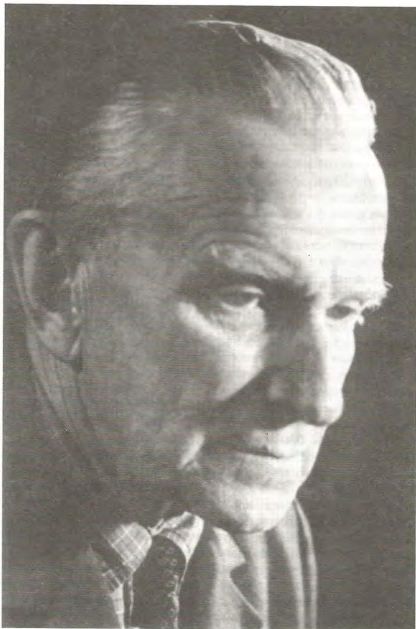
П.А. Северный. 1945 г.