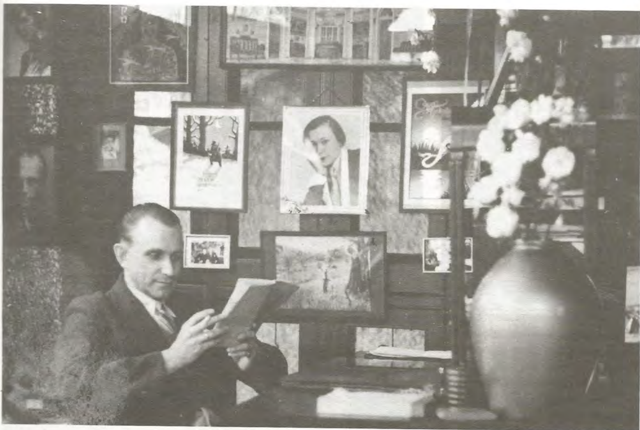
Обложки книг, изданных в Китае

охваченную огнем пожарищ Россию. Революционная красная волна вытолкнула его, сына барона, в страну мало понятную русской душе.